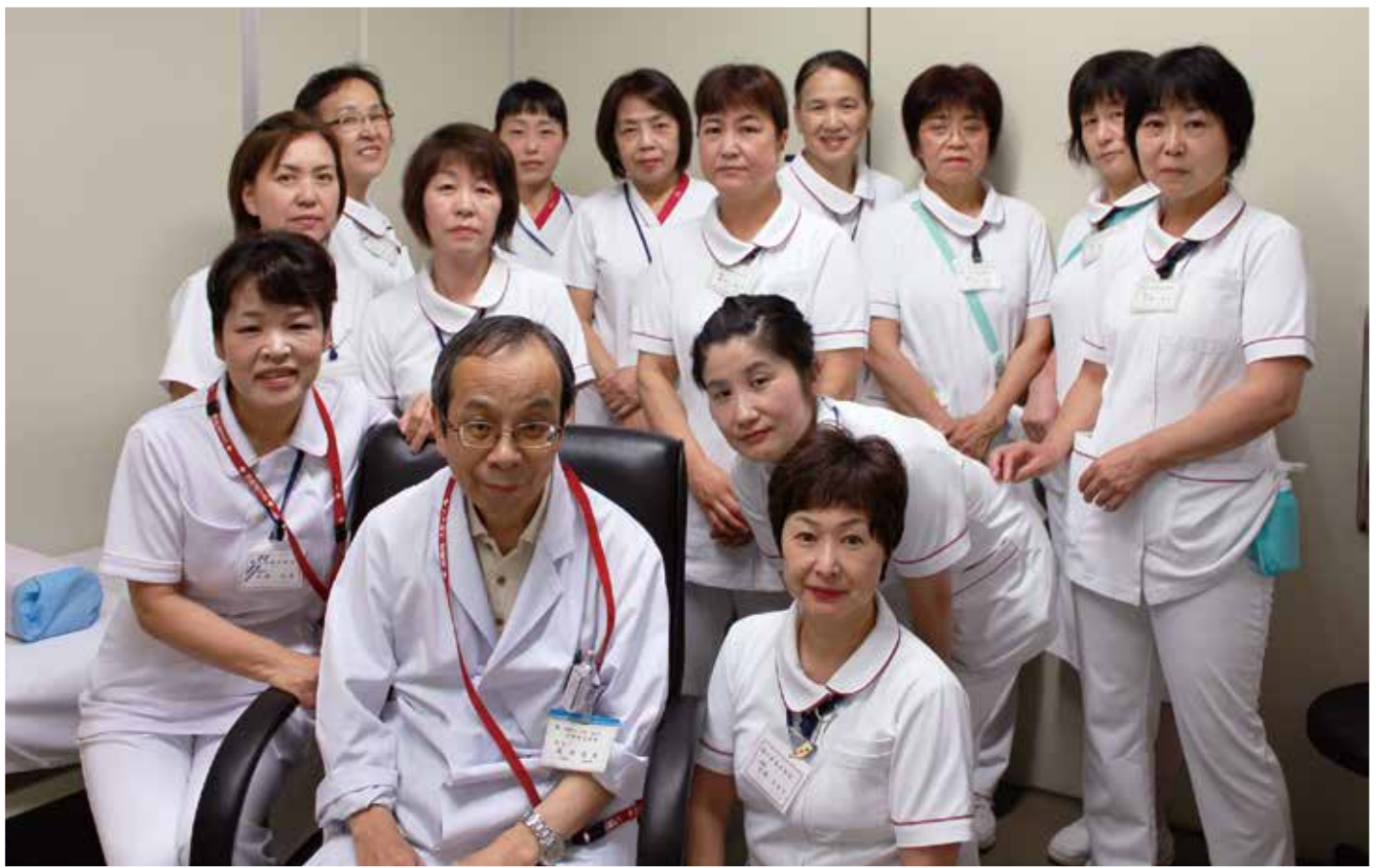
平野総合病院 外来担当職員