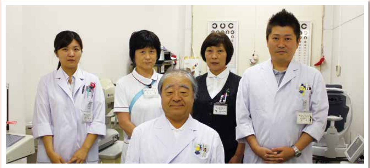
平野総合病院 眼科職員